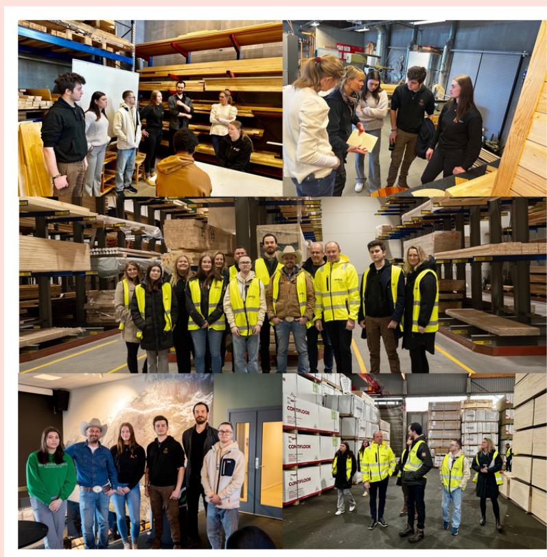
Snekkerambassadørene hos Fritzøe