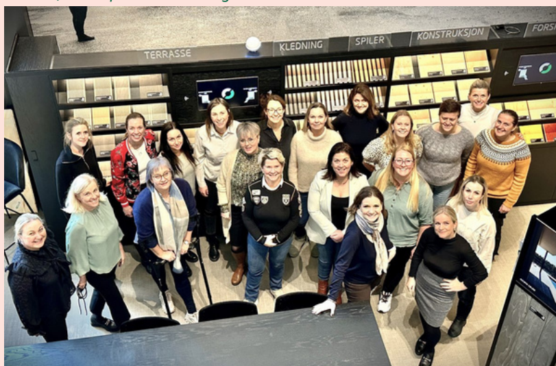
Nettverk for kvinnelige ledere ble etablert i 2023